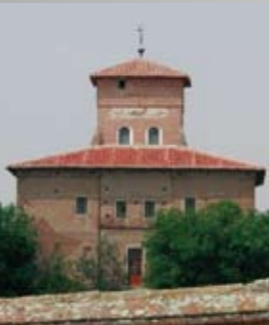
Casa Blanca (3-VI-1931)