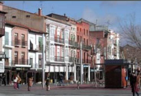
Casco Histórico (25-XI-1978)