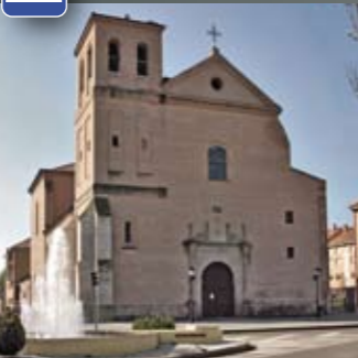
Santiago el Real (18-I-1968)

Información y reservas ☎ 983 810 063 www.palaciorealtestamentario.com Horario de apertura Martes a sábado: de 10 a 14 y de 16 a 19 h. Lunes, domingos y festivos: de 11 a 14,30 h.