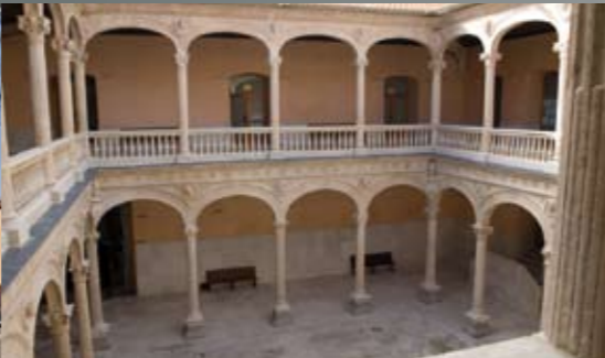
Palacio de los Dueñas (3-VI-1931)