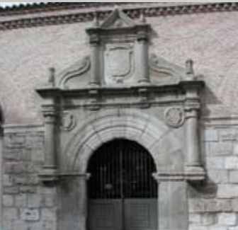
Reales Carnicerías (13-X-1995)