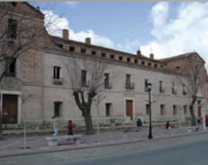
Hospital de Simón Ruíz (13-VI-1991)

Información y reservas ☎ 983 810 063 www.palaciorealtestamentario.com Visitas guiadas De martes a domingo, sólo para grupos previa reserva (24 h. antelación). Puede visitarse el interior del templo (mín. 8 personas, máx. 50) y la torre (mín. 6 personas, máx. 15).